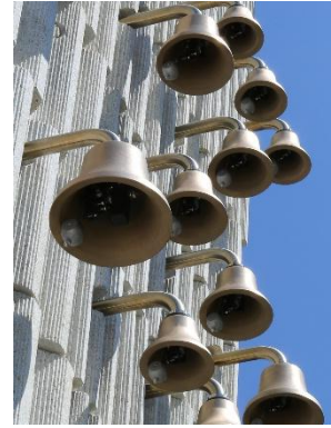
Carillon am ref. Kirchengemeindehaus Magden